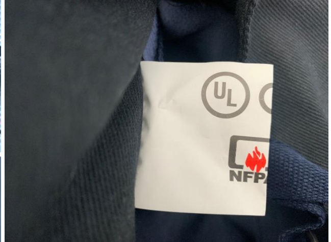
Modèle USA Fire Helmet :